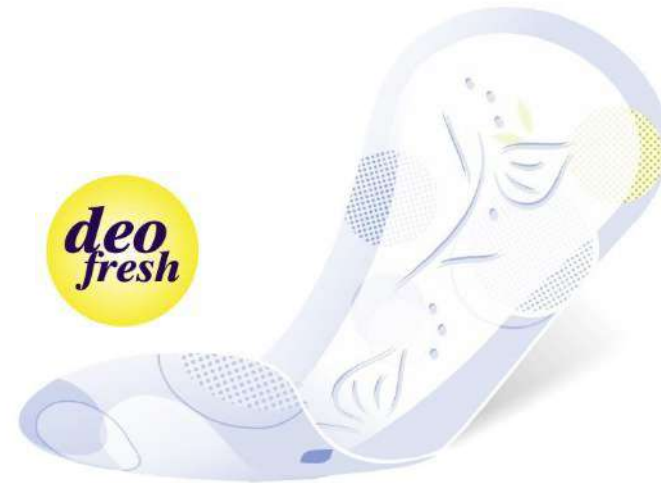
Bella Herbs Tiglio