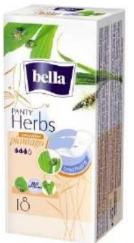
Bella Herbs Plantago