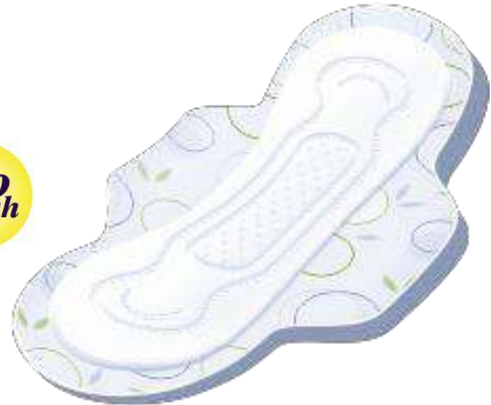
Bella Herbs Verbena