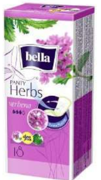
Bella Herbs Verbena