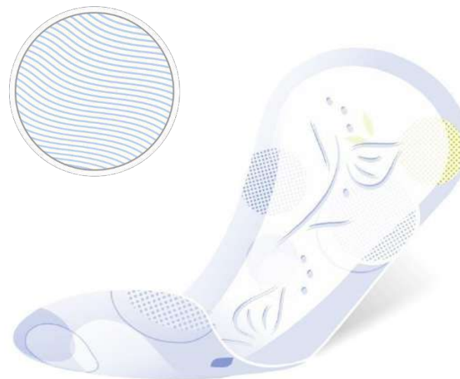
Bella Herbs Tiglio