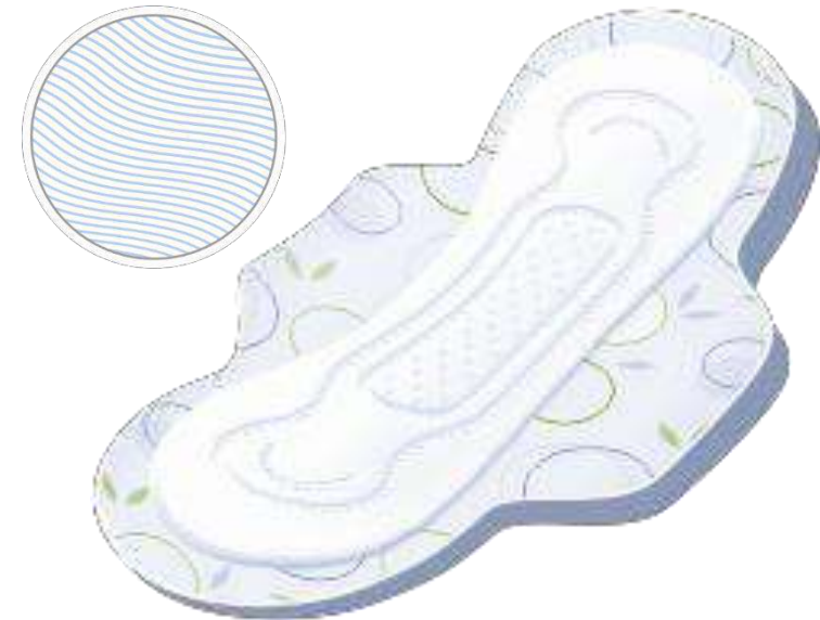
Bella Herbs Tiglio

Creati in tessuto non tessuto, che associato alle proprietà delle erbe, si prende cura della delicata zona intima.